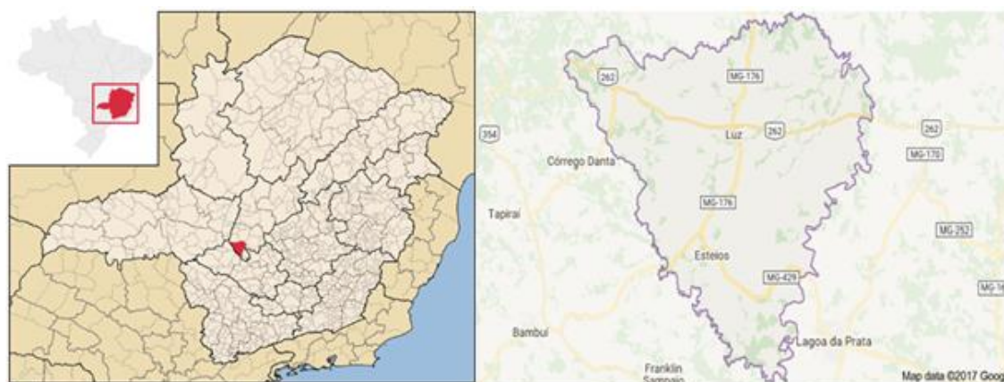
Figura 6 - Mapa da localização da cidade de Luz/MG.

O trabalho foi realizado na cidade de Luz, situada na região Centro-Oeste do estado de Minas Gerais ( Figura 6 ). O município possui uma área territorial de 1.171,659 km 2 , e população estimada pelo Instituto Brasileiro de Geografia e Estatística (IBGE) no ano de 2017 de 18.400 habitantes (IBGE, 2018).